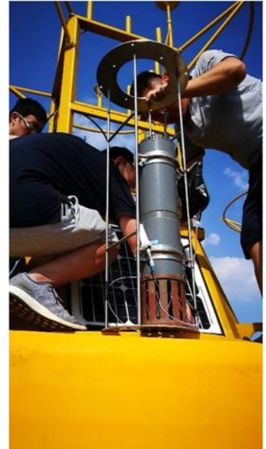
部署中的 pH 传感器